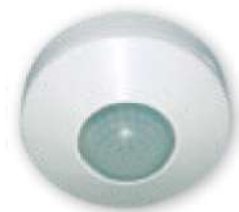
Détecteur de mouvement et de présence