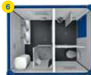
6 1x SA 10' □ ~6m 2