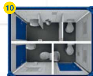
10 1x SA 10' □ ~6m 2