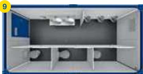
9 1x SA 16' □ ~11m 2