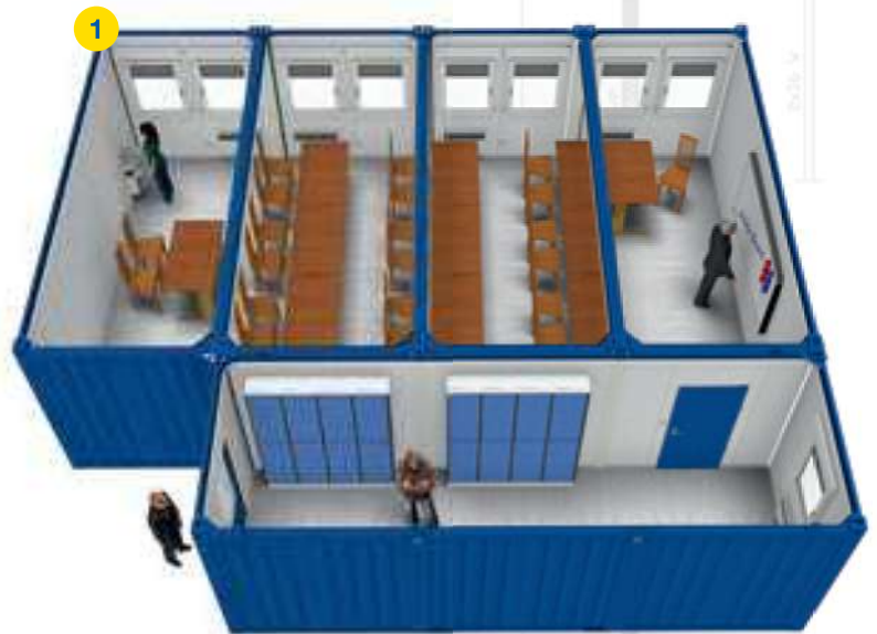
4x BM 20' + 1x BM 24' □ ~68m 2