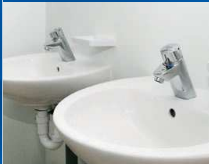
Robinet de lavabo sans contact

Economie d'énergie et réduction d'émissions de CO 2