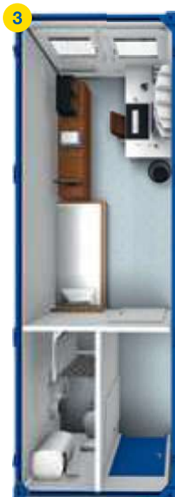
1x BM 30' □ ~20m 2