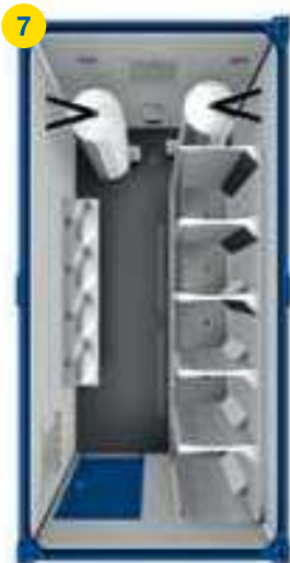
7 1x SA 20' □ ~13m 2