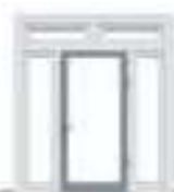
Porte simple centrée