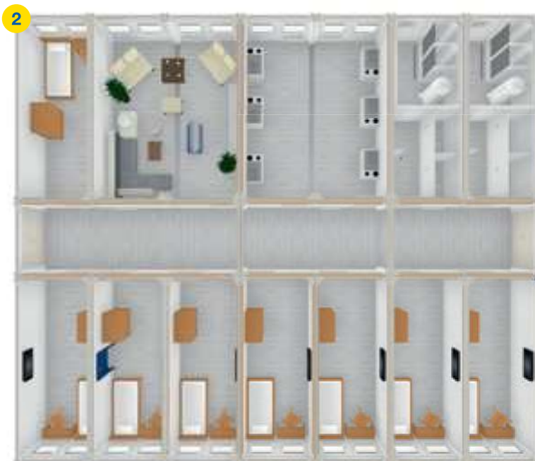
12x BM 20' + 1x BM 24' + 2x BM 16' + 2x SA 20' □ ~221m 2