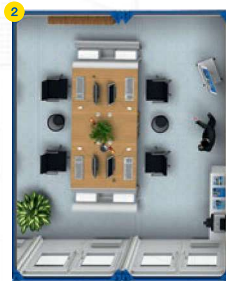
2x BM 20' □ ~30m 2