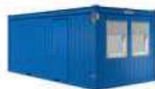
BM/SA 20' XL*