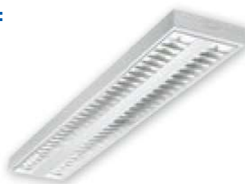
Éclairage à LED

Economie d'énergie et réduction d'émissions de CO 2