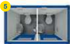
5 1x SA-Box 8' □ ~3m 2

Beaucoup d'autres variantes et combinaisons possibles