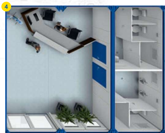
2x BM 20' + 1x SA 20' □ ~39m 2