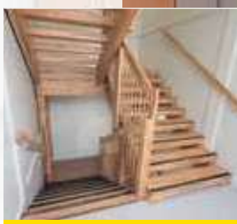
Escalier intérieur avec palier