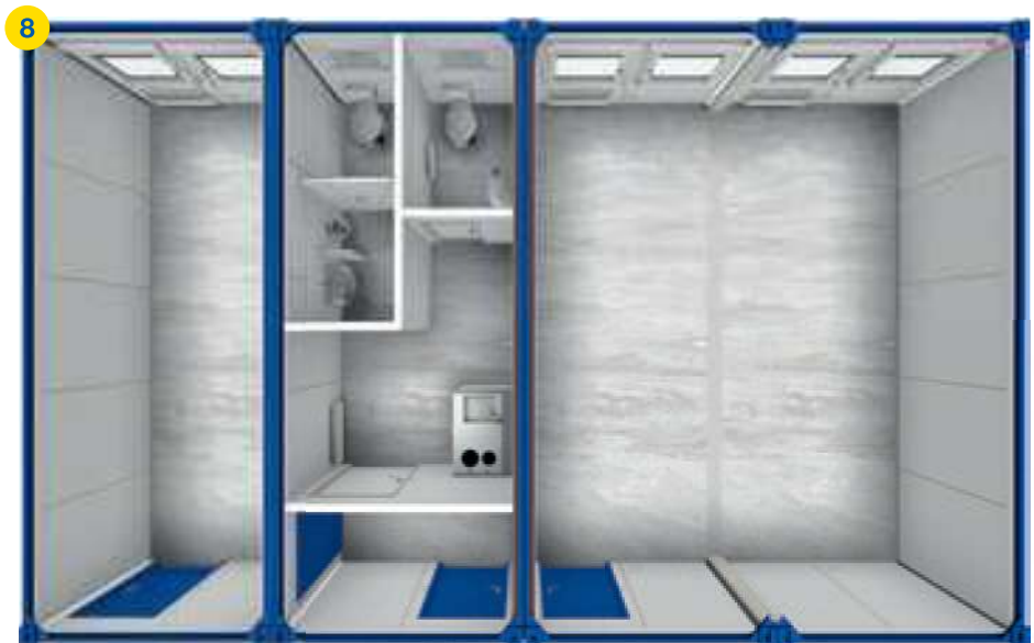
8 1x SA 20' + 3x BM 20' □ ~53m 2