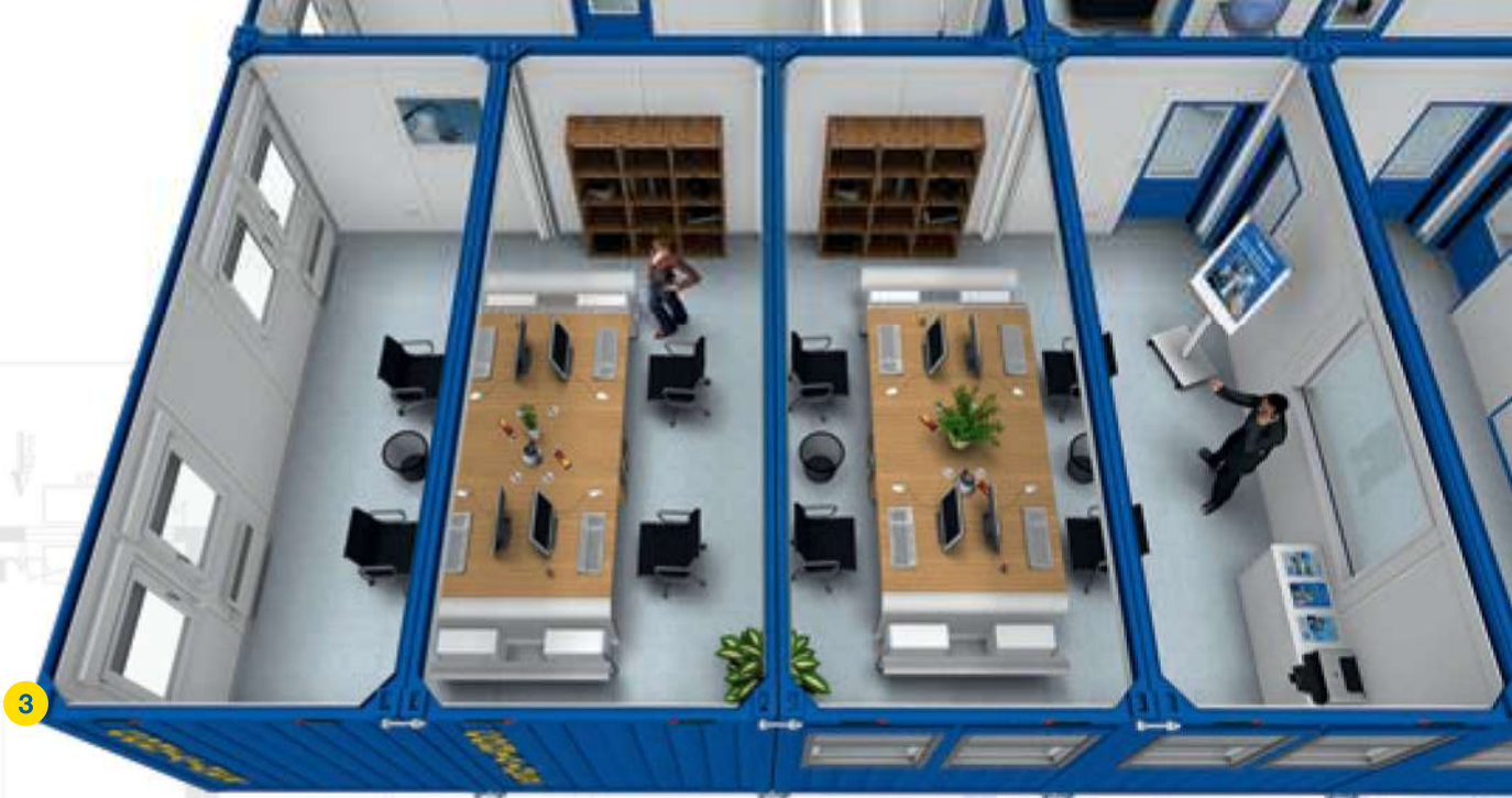
4x BM 20' ☐ ~53m 2