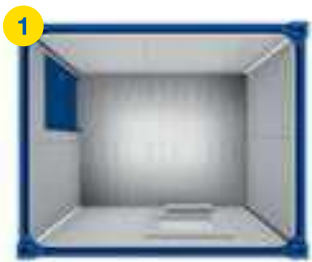
1x BM 10' □ ~6m 2

Sur la base de nos modules individuels disponibles en différentes tailles, il est possible de réaliser de nombreuses combinaisons et agencements.